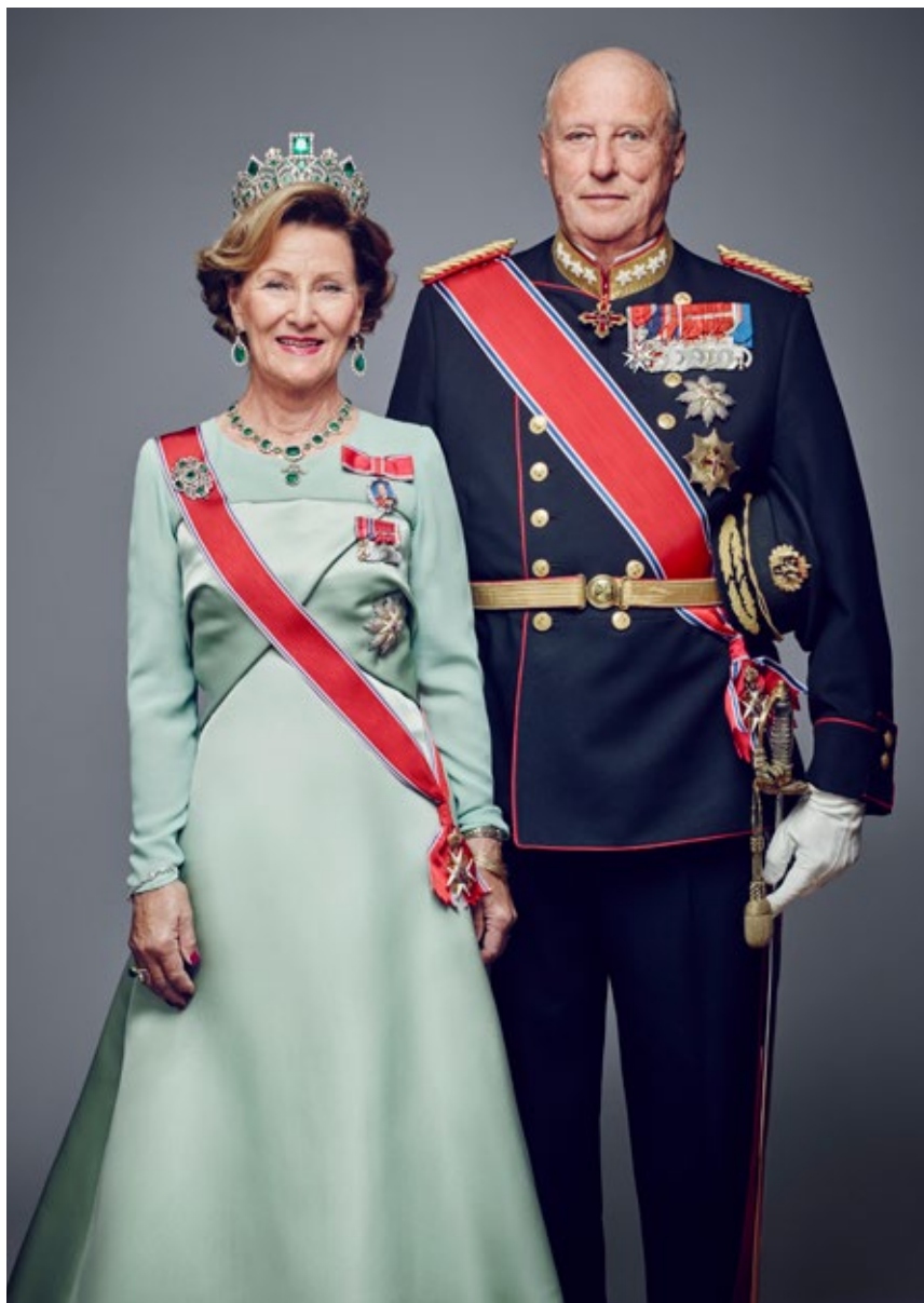
H.M. Kong Harald og H.M. Dronning Sonja