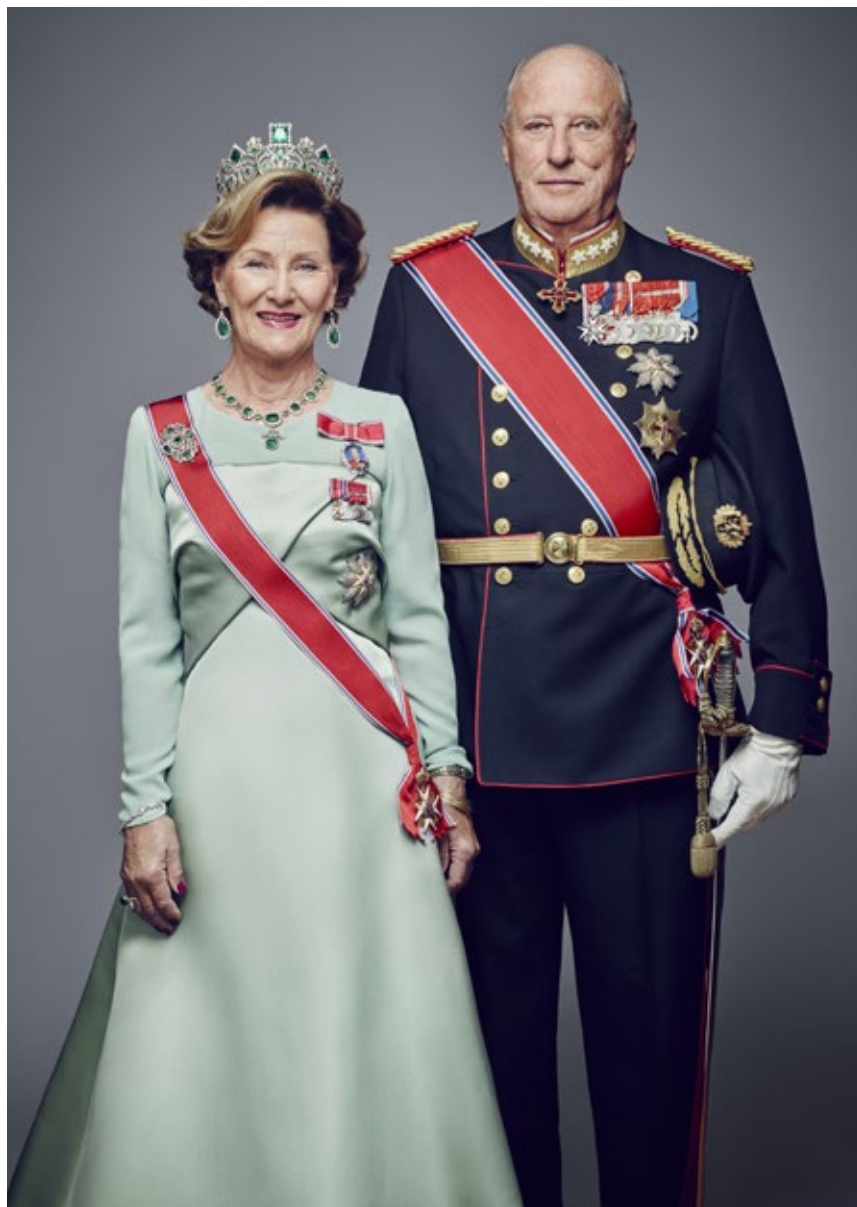
H.M. Kong Harald og H.M. Dronning Sonja